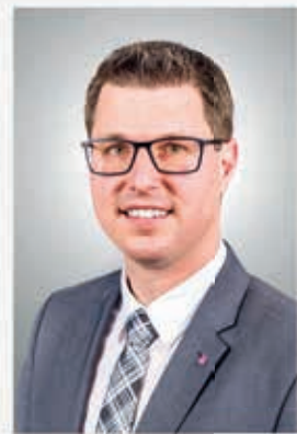
CHRISTIAN HÄRTING Bürgermeister der Marktgemeinde Telfs